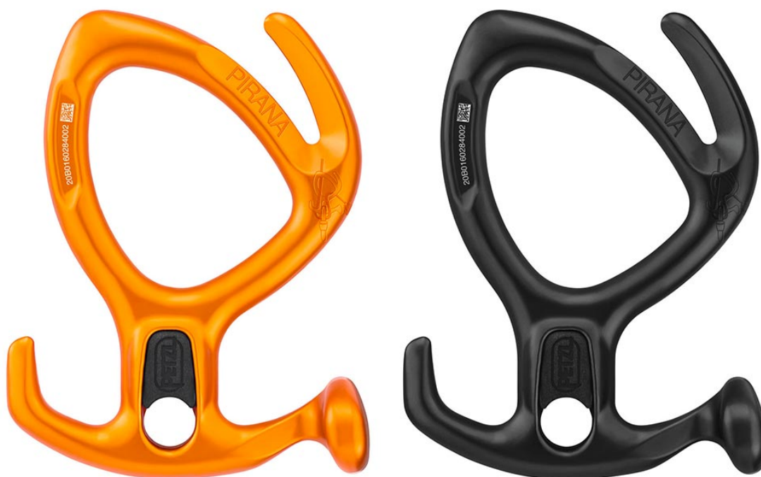
Foto: PIRANA Referenzen D005AA00 und D005AA01