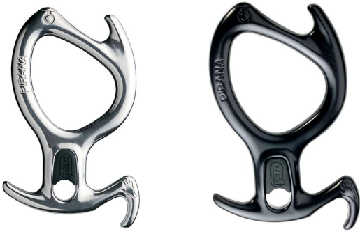
Foto: PIRANA der Vorgängergeneration Referenzen D05 und D05 NOI - nicht betroffen