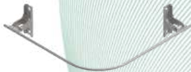
Bild 14: Eckverankerung, Typ: AIO-EDLE-12