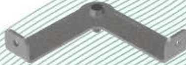
Bild 9: Endverankerung, Typ: AIO-EB-13