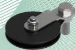
Bild 16: Eckverankerung, Typ: AIO-EDLE-15